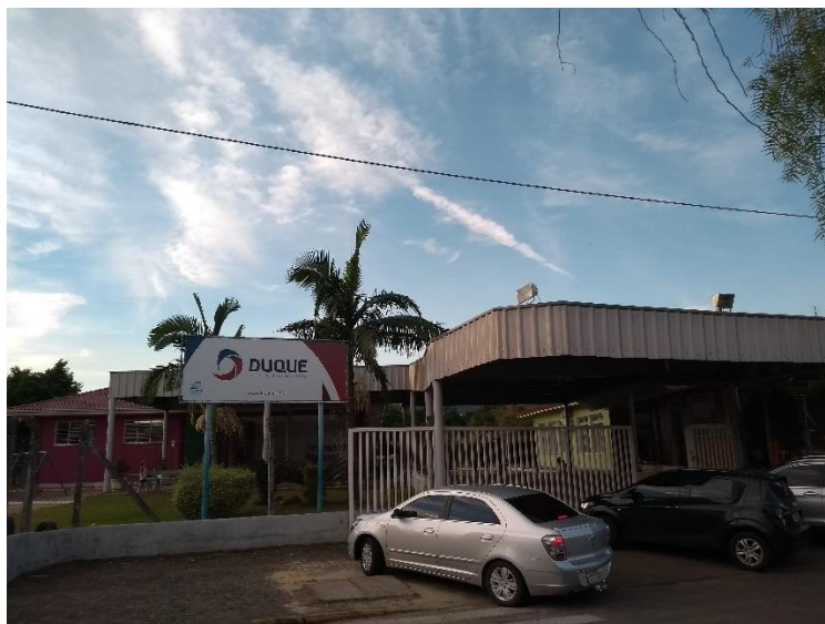
Unidade de Educação Infantil

Em 2003 , após diálogo prolongado com a Paróquia Evangélica, a escola passou a incorporar a antiga Creche Lar da Criança, criada e mantida desde 1985 pela igreja. Ela deixou de ser apenas creche e foi transformada em Unidade de Educação Infantil , aplicando-se desde então o currículo vigente na escola.