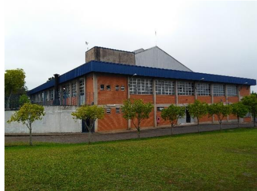
Prédio de dois pisos e ginásio esportivo – construídos entre 1997 e 2001

No primeiro semestre de 1998 , implantou-se o 2º Grau da EJA (hoje Ensino Médio). Desde então, a Escola firmou convênio com as empresas de Sapiranga, a fim de facilitar o reingresso dos alunos aos estudos. Dois anos depois, em 2000 , mais um passo muito importante na história do Duque, iniciava-se a primeira turma do Curso Técnico em Informática .