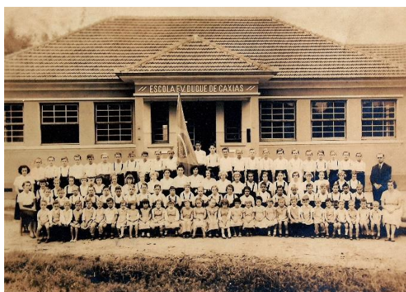
Segundo prédio, atual prédio administrativo. Fotografia de 1954.

O novo nome da escola surgiu em 1940 , por necessidades circunstanciais, decorrentes do envolvimento do Brasil na Segunda Guerra Mundial. Por interferência do governo se implantou o processo de nacionalização do ensino e foi necessário encerrar o ensino em Língua Alemã, contratar professores dominassem a Língua Portuguesa e dar um nome “brasileiro” para a escola. Por isso, escolheu-se Duque de Caxias como patrono para ser homenageado. Dessa época em diante, iniciaram-se as matrículas para alunos de outras confissões religiosas.