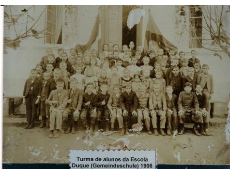
Imagens mais antigas do acervo fotográfico da escola

A história da Escola Duque tem uma relação direta com a chegada de colonos alemães na Colônia do Padre Eterno, a partir de 1833. No entanto, a intensificação do processo migratório ocorreu a partir de 1845 e a escola foi criada somente no ano de 1850 , pelos próprios colonos, em algum momento do primeiro semestre. Eles organizaram uma Associação Escolar (Schulverein) para atender às crianças evangélicas, sendo, por isso, denominada Escola Alemã Evangélica. As famílias evangélicas mantinham essa associação, contratando o professor e providenciando o seu pagamento. Essa Associação foi a mantenedora da Escola até 1938 . Dessa época até 1992 a mantenedora da escola foi a Comunidade Evangélica, hoje Paróquia Evangélica de Sapiranga. Em 1993 a escola passou a ser mantida da ISAEC – Instituição Sinodal de Assistência Educação e Cultura.