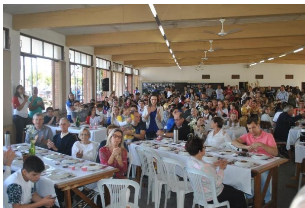
Celebração na Igreja do Redentor e almoço no Centro Evangélico

Mas este foi o ano em que se alterou a estrutura do Ginásio de Esportes , passando a ter piso em epóxi nas duas canchas , pintura branca interna e a reestruturação das salas de aula, transformando duas delas em miniauditório e a implantação definitiva de duas canchas de grama sobre as antigas canchas de areia externas. Deste ano em diante passou-se a locar os espaços do ginásio todos os dias da semana, de domingo a domingo, passando a ser um ponto importante de encontro de diversos grupos de futsal, de futebol de campo, de vôlei, de handebol, de aulas de dança e de pequenas confraternizações. Investiu-se em melhorias na cozinha e na área aberta de entrada, bem como na construção de uma churrasqueira. A escola, além de todas as aulas de Educação Física, realiza seus projetos de Escolinha de Futsal e Handebol, aulas de Hip Hop e Zumba, pequenas festas familiares, comemorações de Dia dos Pais e Dia das Mães, Encontro de Ex-Alunos,