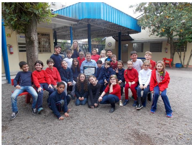
Alunos e professores na Câmara Municipal de Vereadores e na entrada da escola com a placa de homenagem