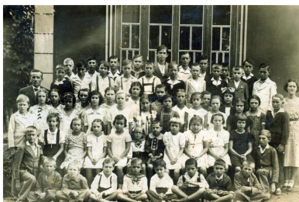
Imagens de alunos e professores no primeiro prédio da escola, em frente ao atual prédio, no local em que está o Banco Itaú

O novo nome da escola surgiu em 1940 , por necessidades circunstanciais, decorrentes do envolvimento do Brasil na Segunda Guerra Mundial. Por interferência do governo se implantou o processo de nacionalização do ensino e foi necessário encerrar o ensino em Língua Alemã, contratar professores dominassem a Língua Portuguesa e dar um nome “brasileiro” para a escola. Por isso, escolheu-se Duque de Caxias como patrono para ser homenageado. Dessa época em diante, iniciaram-se as matrículas para alunos de outras confissões religiosas.